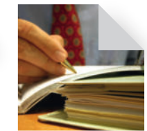
Sonstige persönliche Dienstleistungsunternehmen