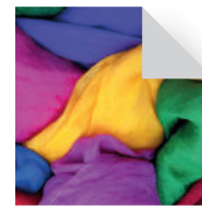
Farb- und Typberatung